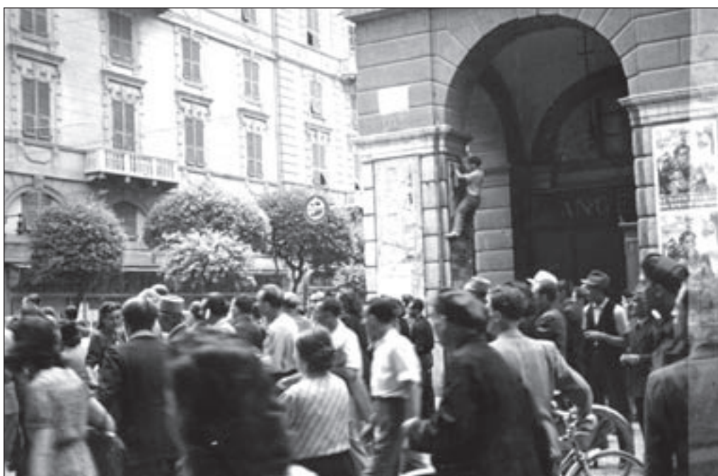
20. 27 luglio, Via Paleocapa: La folla si sposta verso Piazza Sisto IV.