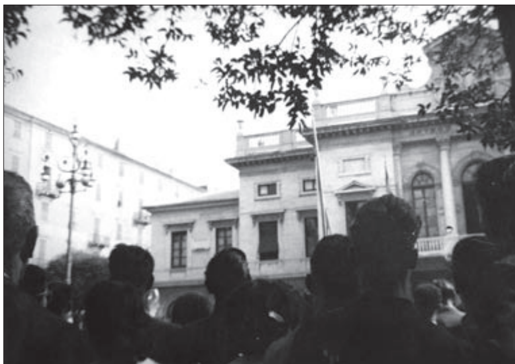
22. 27 luglio, Piazza Sisto IV: da dietro le spalle della folla riunita in Piazza Sisto IV si può solo intuire la presenza di Angelo Bevilacqua, che sta tenendo un discorso dal palazzo del comune..