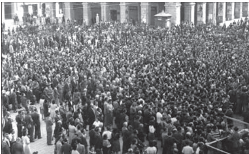
13. 27 luglio, Piazza Mameli - Una folla sempre più numerosa si stringe intorno al monumento.