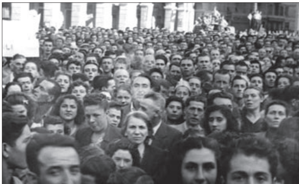
14. 27 luglio, Piazza Mameli - "... Gli occhi di tutti erano accesi, anche quelli preoccupati" (da C. Pavese, La casa in collina ).