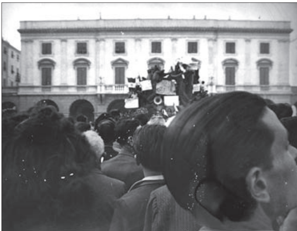
17. Su uno dei cartelli si legge la scritta "assassini".