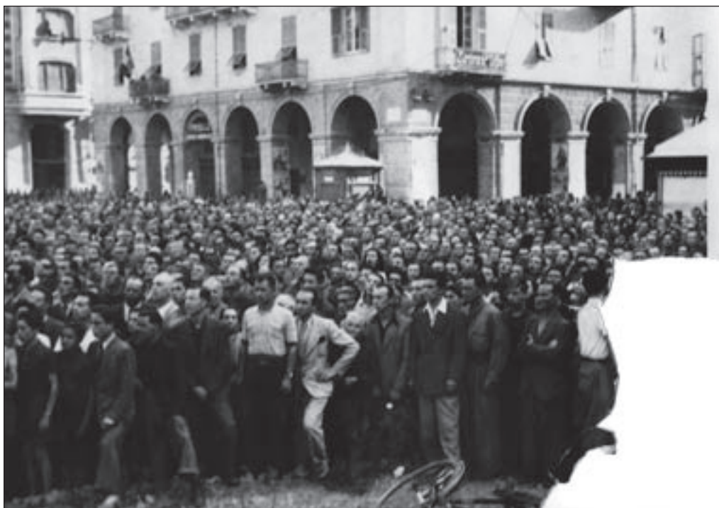
15. 27 luglio, Piazza Mameli – La folla in attesa del discorso dal monumento.