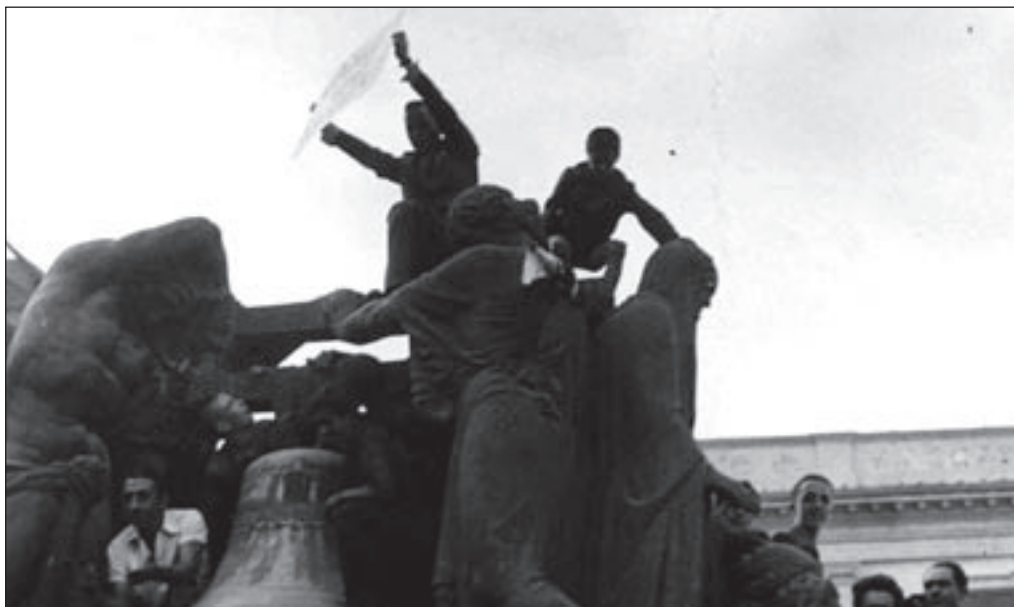
16. Qualcuno si è arrampicato sul monumento ai caduti portando dei cartelli e li mostra dall'alto.