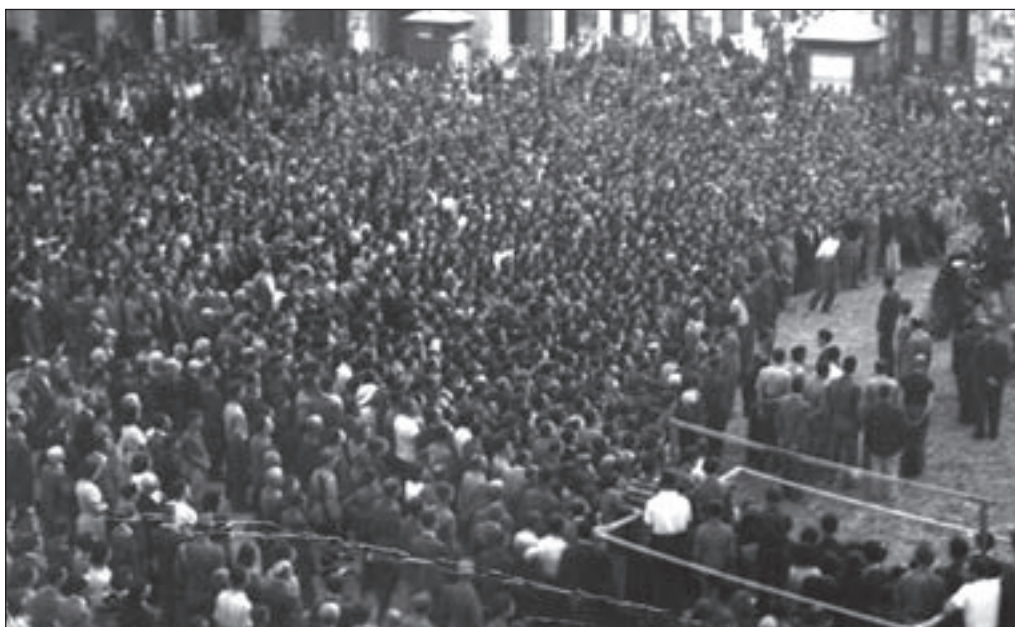
12. 27 luglio, Piazza Mameli - Una folla sempre più numerosa si stringe intorno al monumento.