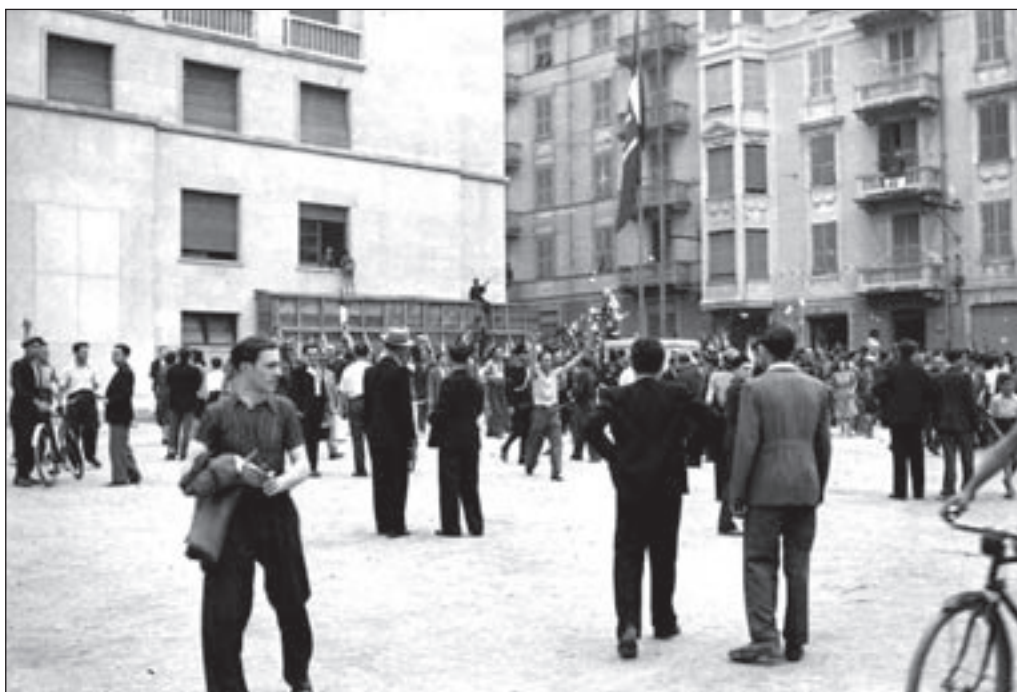
6. 26 luglio, Piazza Saffi - Chi esulta, chi assiste, chi commenta gli avvenimenti della Casa Littoria.