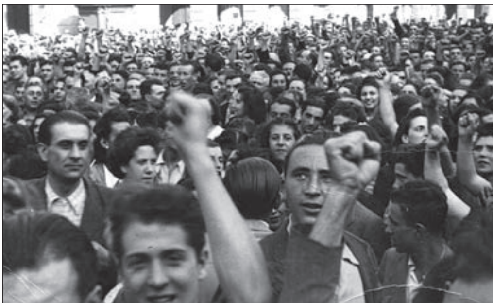
19. 27 luglio, Piazza Mameli - La folla esulta, gli sguardi trasformati.