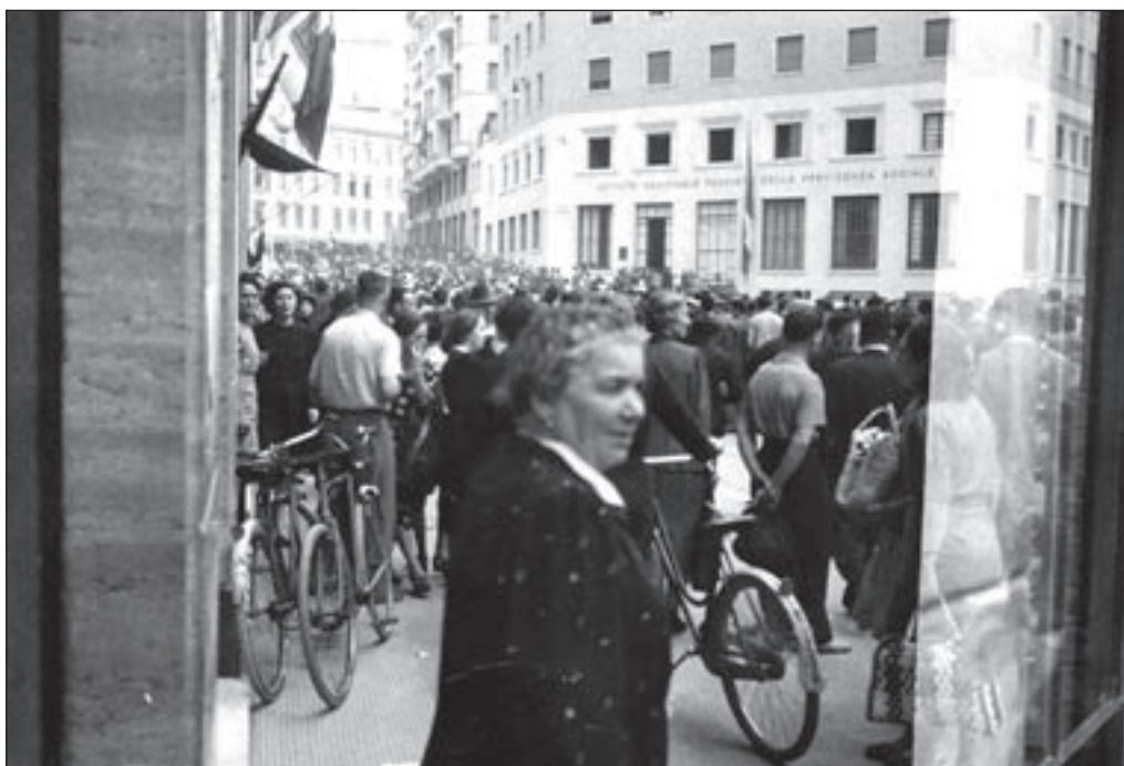
8. 26 luglio, Piazza Marconi - Un momento della manifestazione.