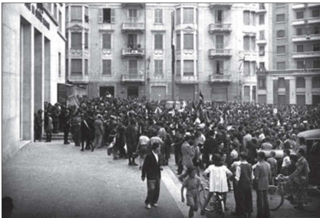
5. 26 luglio, Piazza Saffi - La folla sotto la Casa Littoria.