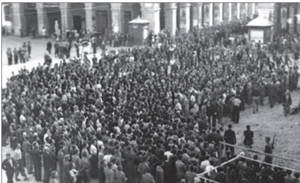
11. 27 luglio, Piazza Mameli - Una folla sempre più numerosa si stringe intorno al monumento.