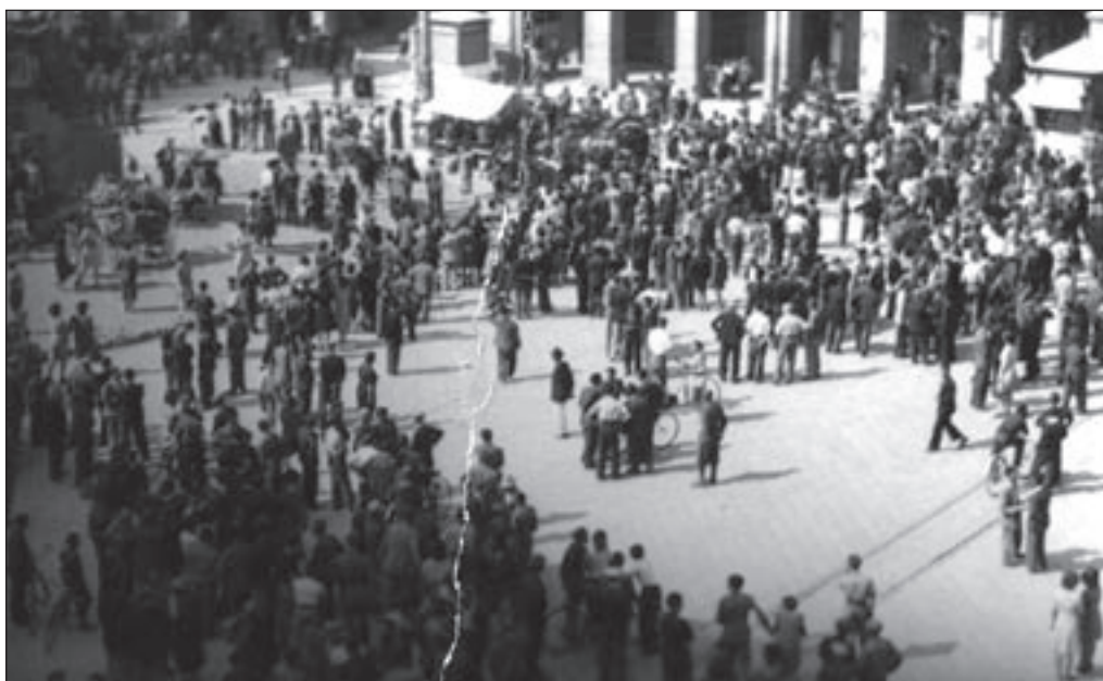
10. 27 luglio, Piazza Mameli - I savonesi iniziano a raccogliersi nei pressi del monumento.