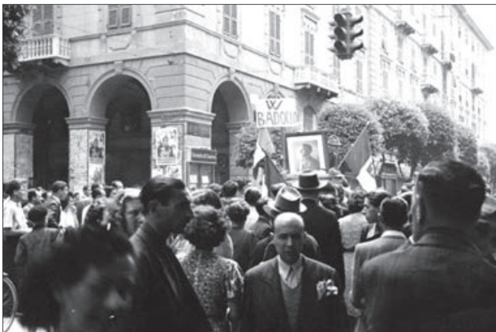
21. 27 luglio, Via Paleocapa: "La folla sfilava verso Piazza Sisto IV, issando cartelli e immagini che inneggiano al maresciallo Badoglio".