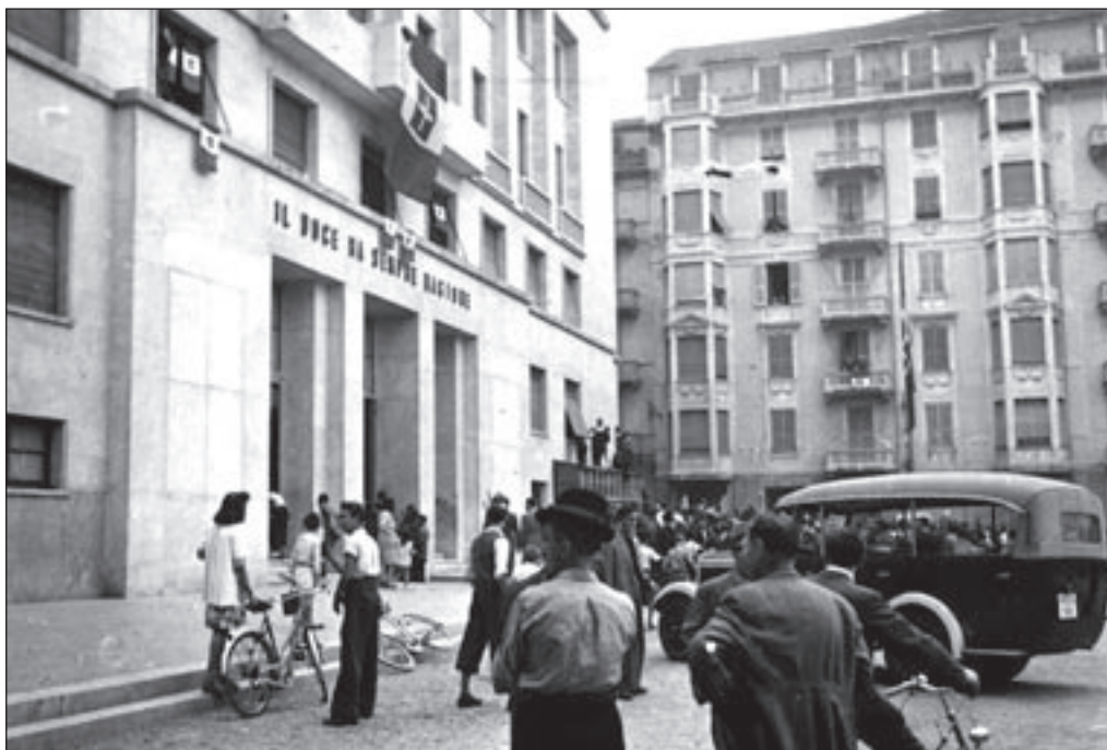
4. 26 luglio, Piazza Saffi - La Casa Littoria invasa.