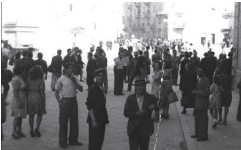
9. 26 luglio (o forse già il 27), Via Paolo Boselli - "... Cominciò quella ridda d'incontri, di parole, di gesti, d'incredibili speranze, che non doveva più cessare se non nel terrore e nel sangue" da (C. Pavese, La casa in collina).