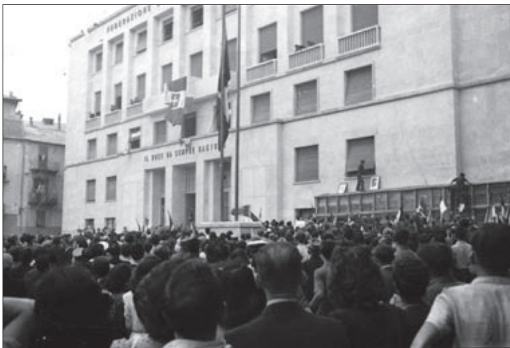
7. 26 luglio, Piazza Saffi - La folla sotto la Casa Littoria durante la sua occupazione.