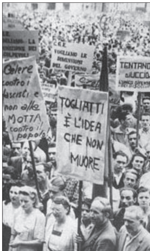
12. Asinistra: Togliatti tra i banchi del governo dell'Assemblea Costituente. All'epoca era ministro Guardasigilli. A destra: dimostrazioni durante lo sciopero generale proclamato dalla CGIL in seguito all'attentato a Togliatti.