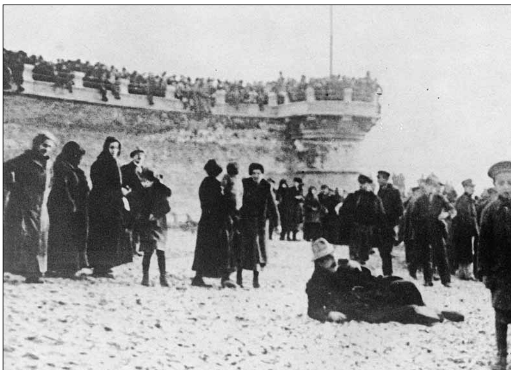
27. La notizia del siluramento si diffonde fulminea a Savona e nei vicini paesi rivieraschi. Moltissimi savonesi accorrono al Prolungamento a mare e sulla spiaggia e assistono impotenti e costernati al tragico evento bellico. (Foto scattata alle ore 11,30 del 4 maggio)