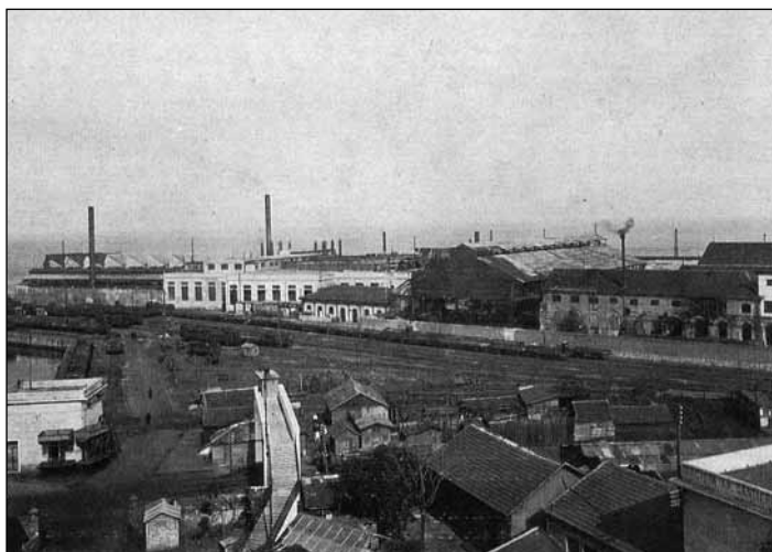
37. Panorama dello stabilimento Ilva di Savona

Si tratta di argomenti ancora molto attuali e capaci di forti sollecitazioni culturali e politiche.