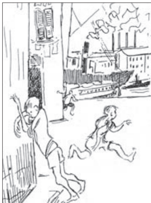
24. Gigi Caldanano visualizza così, nella sua arte, i giochi dei giovani savonesi all'inizio del secolo.