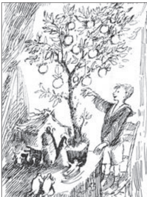
23. Una splendida ricostruzione di Gigi Caldanano dell'albero natalizio secondo la tradizione.