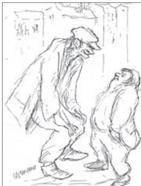
22. O Moinà e u Lazzain, interpretati graficamente da Gigi Caldanano. Per convincere i lettori della perfetta "Simbiosi" tra Giuseppe Cava, poeta e scrittore, e il pittore Caldanano riportiamo il pezzo da dove è stata tratta l'ormai tradizionale illustrazione. Scriveva Nonno Cava: "All'altezza da monolito di O Moinà faceva riscontro la statura da nanerottolo del Lazzain, ed era bello vederli discorrere insieme. O Moinà piegato ad angolo retto, con le palme appoggiate ai ginocchi e il Lazzain con la faccia elevata in su come se speculasse le stelle."