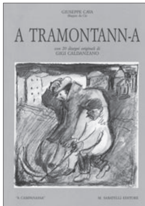
26. La riproduzione della copertina della poesia "A tramontann-a" con 20 disegni originali di Gigi Caldanzano.