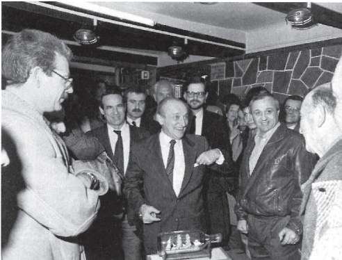
Alessandro Natta, al centro della foto, all'inaugurazione di una sezione del PCI.

Un ritratto intenso, vivo, di Alessandro Natta, appassionato dirigente politico della sinistra italiana ed uomo di profonda cultura, attraverso le sue opere, gli scritti, le testimonianze e i ricordi personali dell'autore. Un profilo dell'ultimo segretario del Partito Comunista Italiano che ripercorre le tappe principali della sua esperienza nazionale ma anche il periodo della sua formazione, dalla "Normale" di Pisa alla guerra, ai campi di concentramento nazisti e del suo ultimo tratto di strada, quello del ritorno in Liguria e della riscoperta delle antiche passioni per la storia e la letteratura. Il libro contiene inoltre una ricchissima parte dedicata alle biografie di molte personalità citate nell'opera, per non dimenticare non solo Alessandro Natta ma coloro che sono stati parte importante della storia della sinistra italiana e del nostro Paese. Questa pubblicazione è un contributo per riportare ordine nella storia recente e far luce sulle scelte e le responsabilità della classe dirigente del PCI nei decenni passati, in un periodo di grande rilevanza. Attraverso la vita di Natta e il suo esempio si deve tentare una rivalutazione della politica come strumento per affermare l'interesse generale, per comprendere le trasformazioni economiche e sociali, per la formazione civile e culturale di ognuno.