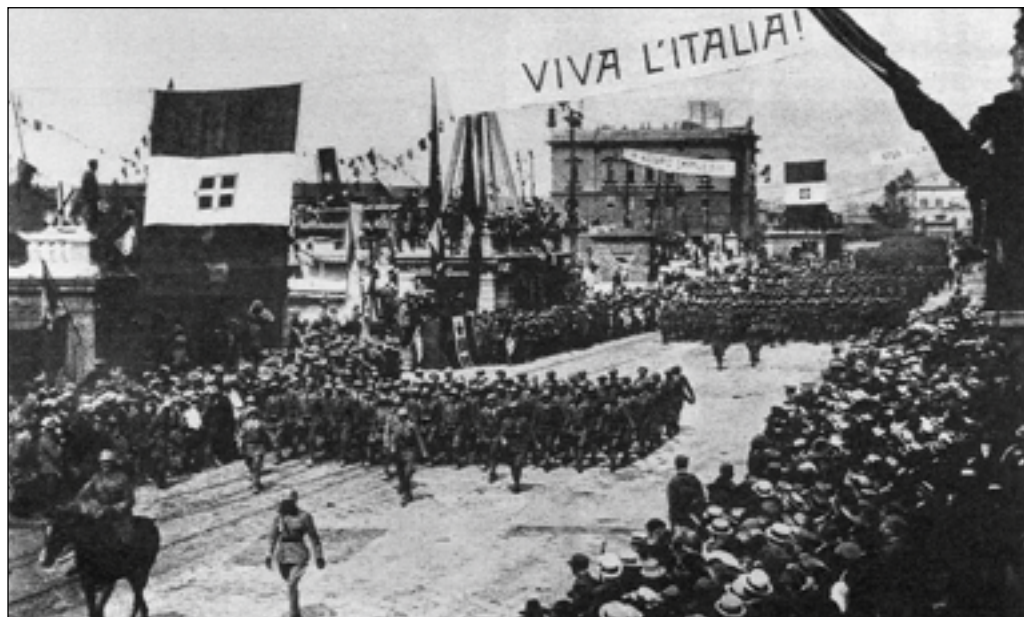
1. Nella foto, gli arditi del generale Zoppi ad una sfilata di soldati nel 1919. Disobbedendo agli ordini ricevuti, anziché fermare D'Annunzio in marcia verso Fiume, si unirono alla spedizione per occupare la città.

Direttore dell'ISREC della provincia di Savona