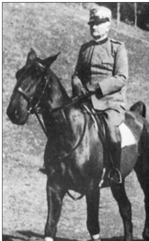
4. Il Maresciallo d'Italia Enrico Caviglia in sella al suo cavallo preferito, durante la sua cavalcata quotidiana.